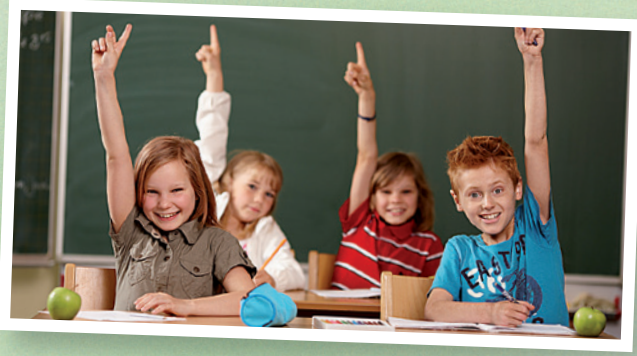
Kim iyi ve saglikli beslenirse, iyi Not'lar alır.