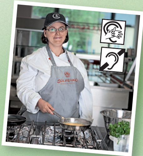
Wolfenbüttel ilcesinde ilk Entegrasyon calismasi.