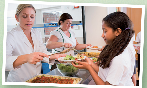
...cogu bölgesel Okullar'da ve Kantin'lerde zaten tabaklarda.