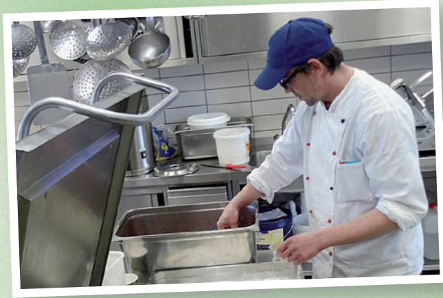
Lezzetli gidalar mutfagimizda am Exer Wolfenbüttel'de her gün taze pisiriliyor.