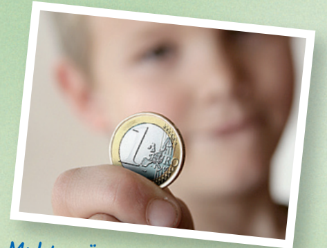
Muhtac Öğrenciler icin DRK-Kreisverband Okul beslenme maliyetini karsiliyor.