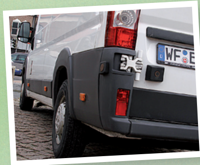
Cogu Tedarikci ve Isbirligi Ortaklari o cevreden geliyor.